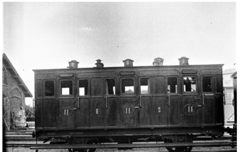
Av dei eldste passasjervognene med stigbrett langs heile vogna.