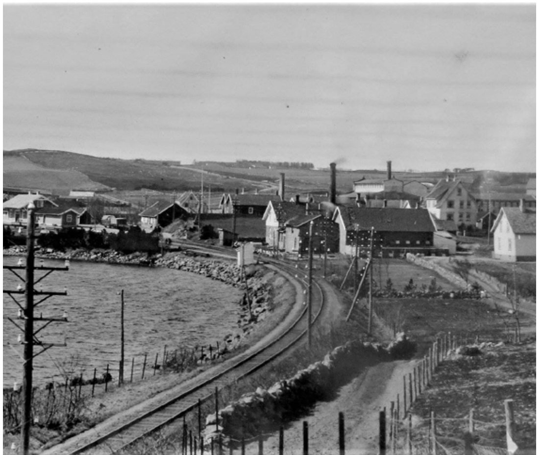
Klepp stasjon (bygninger til venstre) mellom 1924-30.