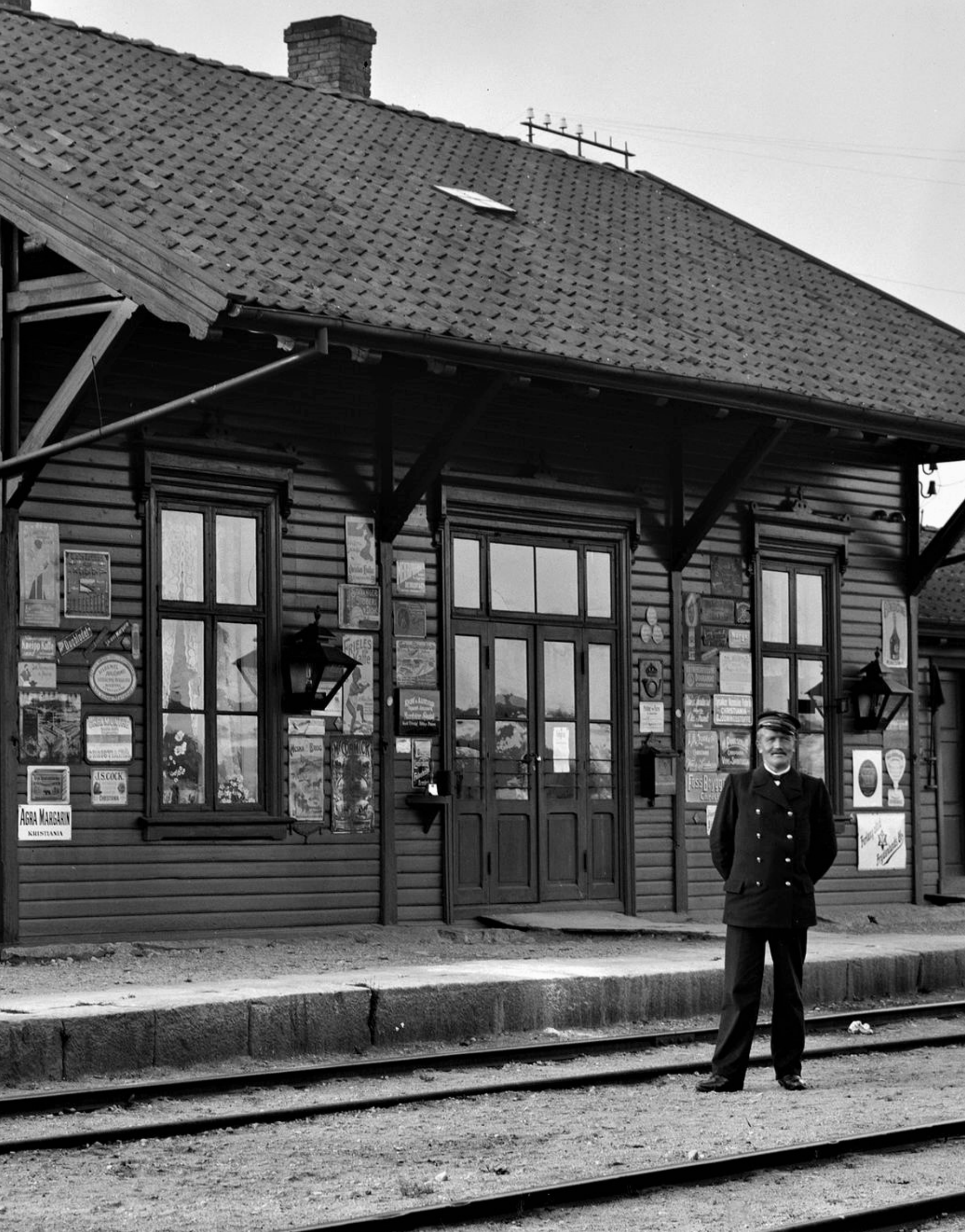
Klepp stasjon ca 1900 med stasjonsmeister Ingebret Mossige.