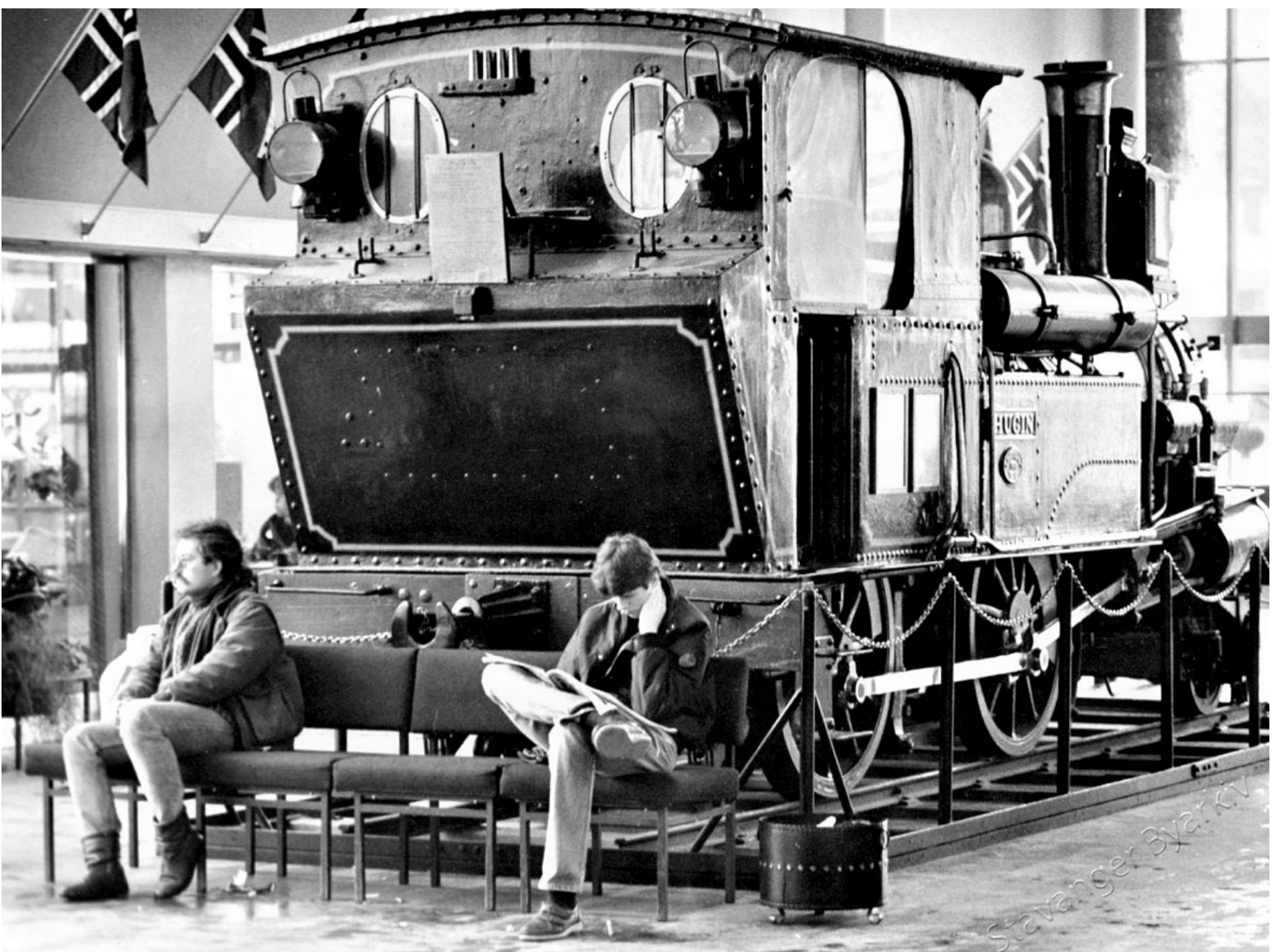
Det gamle lokomotivet «Hugin» stod lenge i venteromet i Stavanger.