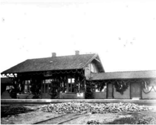
Klepp stasjon pynta til Kong Haakons besøk i 1906.